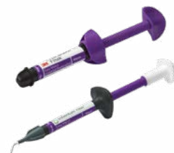
Warm (W): A3.5, A4, B3, B4, C3, C4