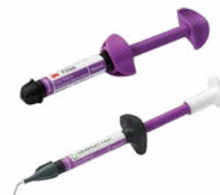
Natural (N): A2, A3, C2, D3, D4