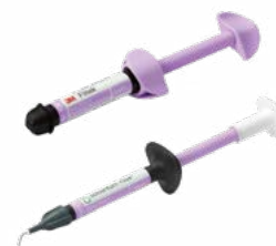
Bright (B): A1, B1, B2, C1, D2

Además, se pueden utilizar con el calentador de composite Solventum™ Filtek™ portátil, rápido y fácil de usar.